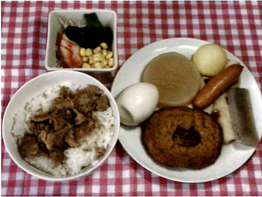
過去のメニュー【おでん】