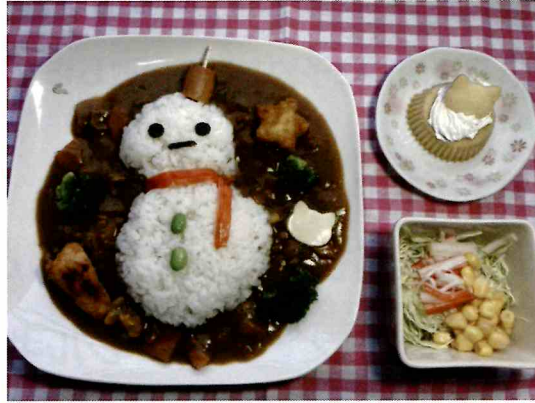
過去のメニュー【雪だるまカレー】