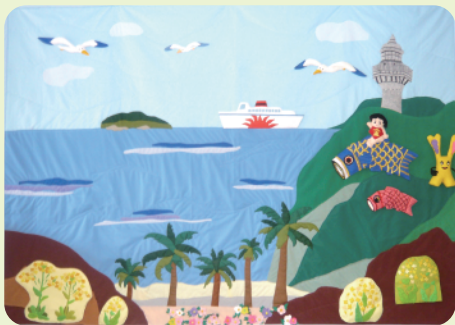
ボランティアセンターを彩る四季／「五月」 ＊登録ボランティア・布おもちゃグループ「ポケット」が製作したタペストリー(150cm×200cm)