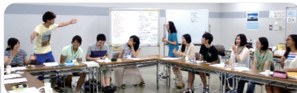
実行委員会の様子