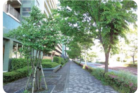
思わず散歩したくなる平成町の街角

協が各地域において地域福祉活動に取り組んできましたが、58年ぶりに新しい地区社協が誕生し、18地区社協になりました。今後の地域福祉活動に乞うご期待! 市社協も精一杯応援します!