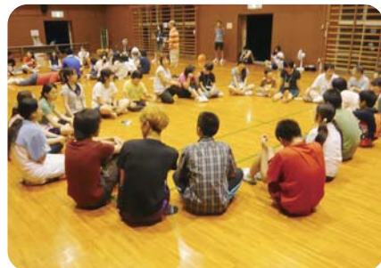
みんなで輪になって

15歳(高校1年生)以上で、「元気!(^^)!!」と「子どもたちと優しく接してくれる 気持ち」がある方、“ふれあいキャンプ”と一緒に暑い夏を吹き飛ばしませんか。 このキャンプでは、主に知的な障害のある小学校3年生から高校3年生の 子どもたちと、泊まりながら楽しく過ごします。