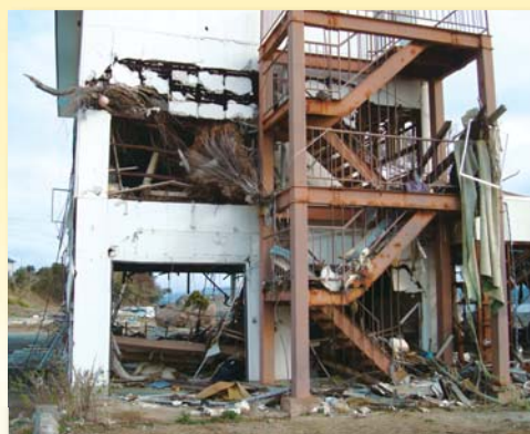
持ち主と連絡が取れず残っている建物 (4月20日/宮城県気仙沼市)

被災地の復興状況は、地域によって違います。 ボランティアではなく、できる限り住民たちで作業を行なっている所。住民の数が減ってしまったため、ボランティアが入ることが励みになる地域。 しかしどの場所にも共通しているのは、今日も、美しい風景と住民の笑顔がまぶしい我がまちを取り戻すために、一人ひとりが頑張っていることです。 「私たちは忘れられていない」…被災した方々がそう感じられることが大きな力になるはずです。