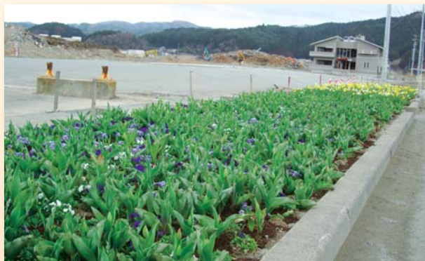
ボランティアが植えた「メモリアルフラワーロード」 (4月20日/岩手県陸前高田市)