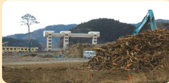
奇跡の一本松 (4月20日/陸前高田市)

被災地の復興の状況は各地で大きく異なり、外部ボランティアの受け入れも、一様ではありません。多くは緊急雇用策で、地元住民の就労が優先されていますが、ガレキ処理が遅れている、南三陸町や陸前高田市のような場所もあります。