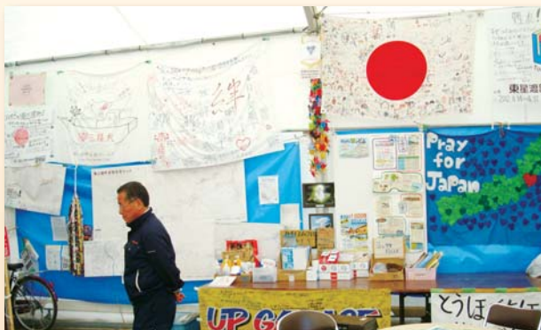
ボランティアセンターの壁に掲げられた全国からの応援メッセージ (4月19日/宮城県南三陸町)