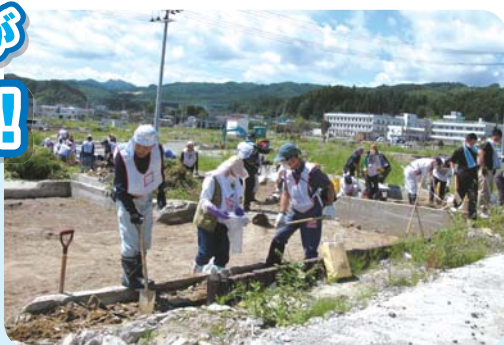
活動するネットワークのメンバー (平成23年8月27日/岩手県山田町)

阪神・淡路大震災の年、ボランティア元年と言われる平成7年に準備会を立ち上げ、2年後のナホトカ号重油流出事故の際は、社協と共にボランティアバスを出しました。平成9年6月の設立以来、さまざまなボランティア団体が、日頃から顔の見える関係を作り、災害時に協力し、円滑に活動することを目指した取り組みを行なっています。