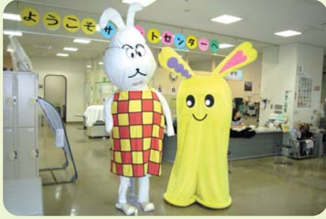
フッピーのよこすか探訪：市民活動サポートセンター(のたろんと一緒に)