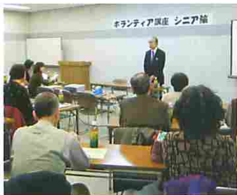
“先輩ボラ”の話に耳を傾ける受講者

去る2月3日(土)、いわゆる「団塊の世代」の方たちを含む15名に参加いただき、ボランティア講座(シニア編)を開催しました。 講座の内容は、ボランティア活動の基礎知識や先輩ボランティアの話、ハンディキャブ車(車いす)と乗り降りできるリフト付の自動車)の説明、ボランティアの一日体験など。 ある参加者は、「ボランティアをずっとしてみたかったけど、なかなかきつかけがつかめず、今回思い切っって参加しました。でも、昨日から緊張して眠れず、今も胸がドキドキしています」と不安な表情を浮かべていましたが、車いすの移乗では初めてだから…。でも、知らないことを知るの楽しい」と緊張の中にも