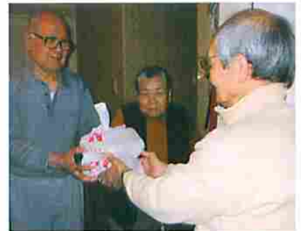
お変わりありませんか?

お弁当を利用している高齢者のみなさまに『お食事』とともに『あんしん』をお届けしています。利用者アンケートに「外に出る機会も少なく心細い時もありますが、協力員に会って、話ができると元気がでます。また、偏食がちな食事でしたが、お弁当を食べるようになって体調が良くなりました」と感謝の言葉が寄せられています。協力員からも「雨の日、風の日もありますが、お弁当を心待ちにされている利用者にお会いするとホッとするとともに、充実感でいっぱいになります」との報告がありました。