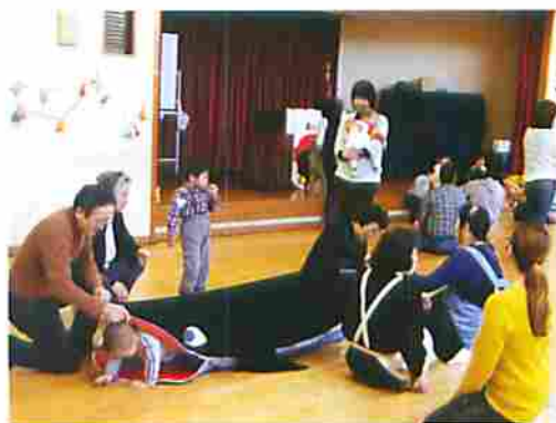
保育ボランティア体験では子どもたちから元気をもらいました

時折笑顔を浮かべて話してくれました。 保育ボランティア体験をしたある受講者からは、「いつもは仕事の関係で高齢者との関わりしかなかったので勝手が違うけど、良い経験になりました」との感想。 最初は、大勢の女性ボランティアの中の男性一人ということと、子どもたちも近寄りがたい様子でしたが、アイデアで子どもたちの心をしっかりGEEI!していました。 「今まで一歩がでなくて何もやらなかったけど、楽しいです。まだまだですけど」と話してくれた受講者もいます。 外での活動ということもあり寒