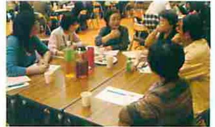
こんな和やかな雰囲気です。