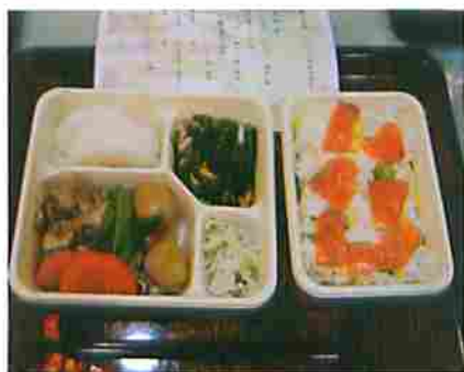
高齢者福祉施設や病院でつくられた栄養バランスのとれたお弁当