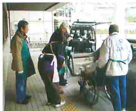
ちょっと緊張しています…病院ボランティア体験中!

い中での活動ですが、来院者とのちよとした出会い・ふれあい・助け合いを楽しみにその後も継続して病院での活動を続けています。 今回、受講された方の中には、あらかじめ自分の活動が決まっている方もいれば、何もわからないままとりあえず受講してみようと参加された方もいます。 多くは何をやっているのかわからないといった方たちでしたが、何らかのきつかけづくりにはなったのではないのでしょうか。 今回は反省会でもあがったものと具体的に知りたいとの声を受けて、テーマをしばらく、ボランティア講座を開催することになりました。 ★6頁に掲載!