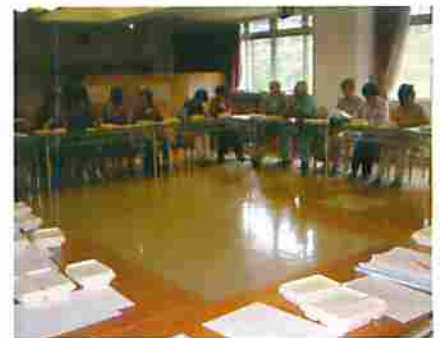
配食協力員研修風景

利用希望される方は、お近くの区域担当民生委員を通じて、市役所長寿社会課に申請ください。費用は一食500円です。なお、ふれあいお弁当は、市内12カ所の社会福祉法人の高齢者福祉施設や病院でつくっており、お住まいの地区によって、週4回のメニューや配食曜日が異なります。